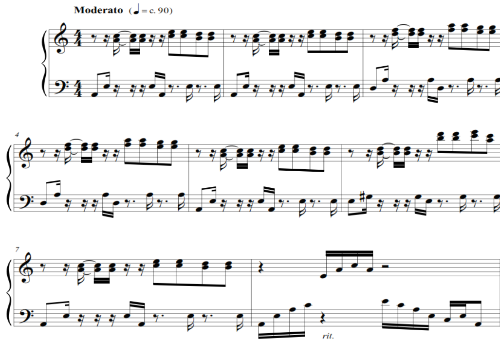
Figura 6.- Pasaje escrito para la marimba