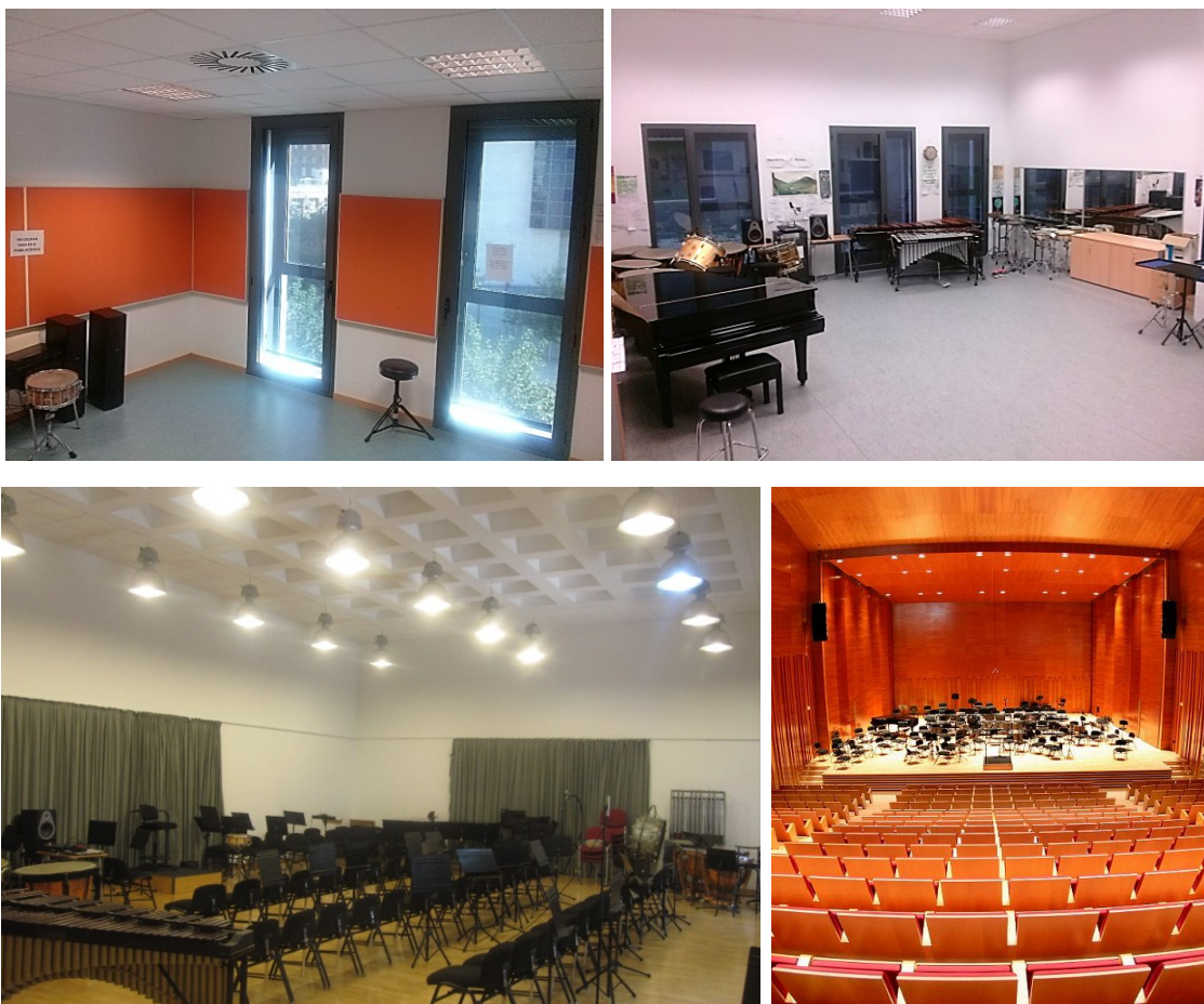
Figura 7.- Cabina de estudio 208 (arriba izq.), Aula percusión 027 (arriba der.), Aula de orquesta 102 (abajo izq.), Auditorio del Conservatorio (abajo der.)

Planta rectangular estilo shoebox, con un anfiteatro posterior. Geométricamente este tipo de paralelepípedos han dado lugar a los auditorios decimonónicos cuya acústica se considera, aun hoy, la óptima para la música sinfónica [13]. Uso: Conciertos, operas, recitales, etc. El auditorio posee, en las paredes laterales del público, difusores a base de láminas verticales de madera de distinto grosor y separación, similares a los difusores cuadráticos comerciales QRD.