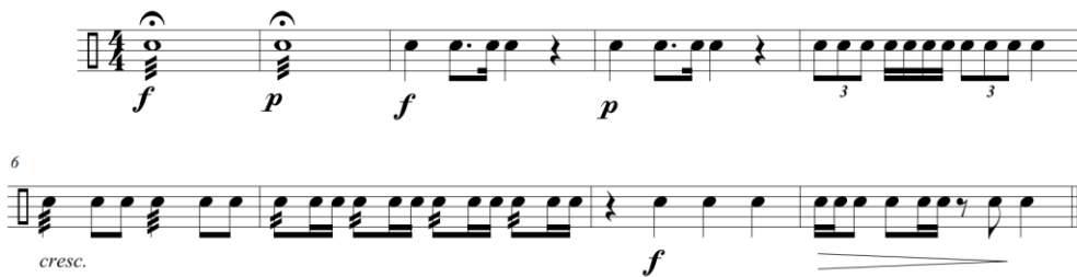
Figura 4.- Pasaje escrito para la caja