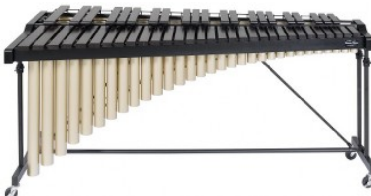
Figura 3.- Marimba