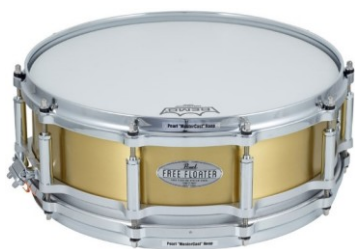
Figura 1.- Caja