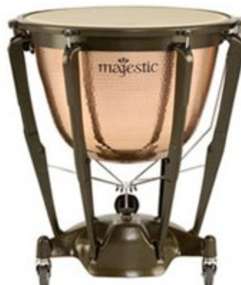
Figura 2.- Timbal