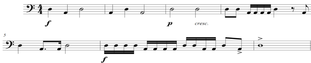
Figura 5.- Pasaje escrito para el timbal