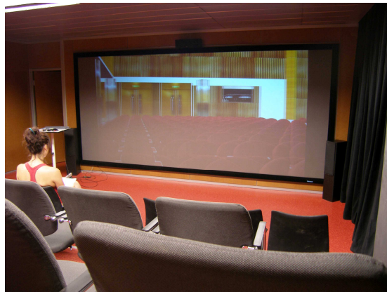
Figura 3: Powerwall con proyección del Paraninfo.

La Powerwall (Figura 3) es una gran pantalla retroproyectada de alta definición (2x5 metros) que, al igual que el CAVE, emite imágenes estereoscópicas que se visualizan con la ayuda de gafas polarizadas sincronizadas con los proyectores. La Powerwall se encuentra en una sala con capacidad para 25 personas situadas en una grada de 4 filas. Actualmente, ésta dispone de un sistema de altavoces 5.1 para emitir sonido espacial.